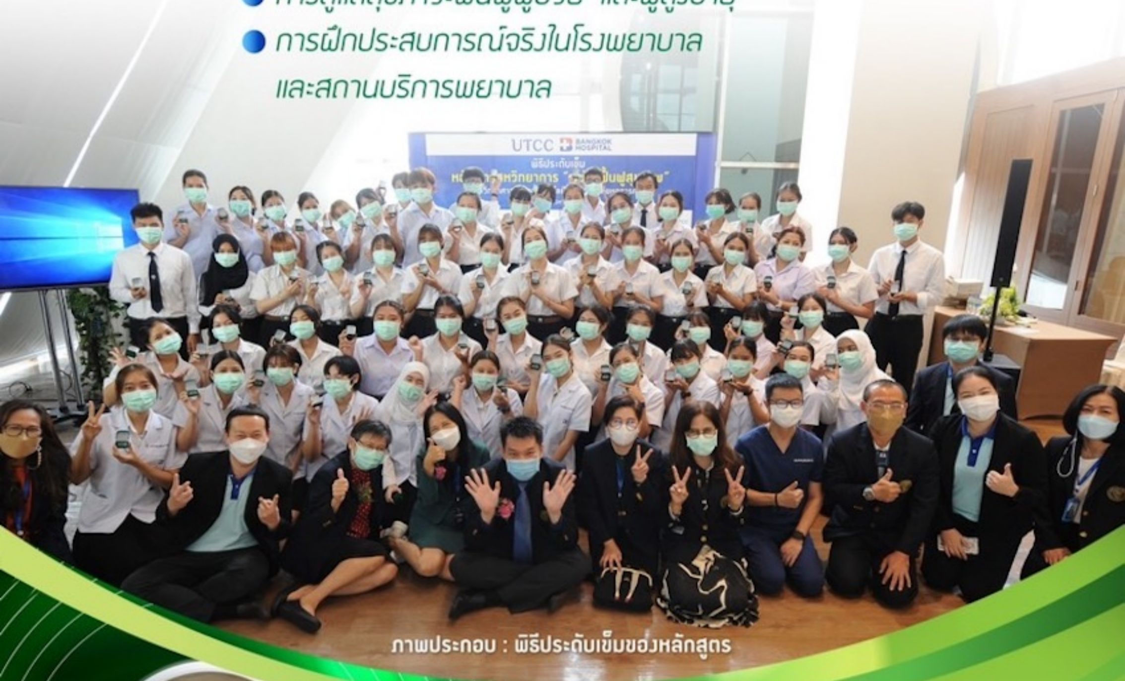
ภาพประกอบ : พิธีเปิดชั้นเรียนหลักสูตร